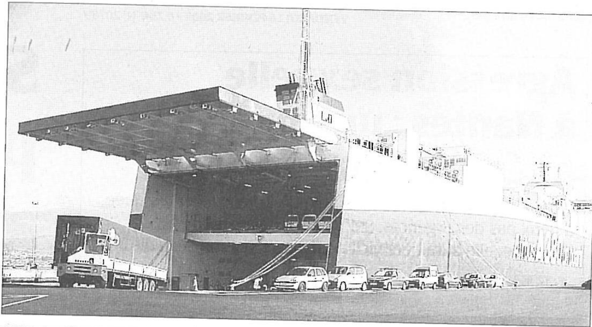
SAS Busto utilise les gros bateaux qui assurent le transport de marchandises.

La société de transport et de logistique s'appelle SAS Busto. Elle a ancré ses bureaux à Montoir-de-Bretagne, au terminal de marchandises